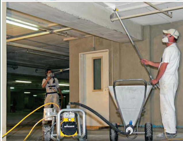
Безвоздушный мембранный насос

"Силач" для эффективного нанесения краски